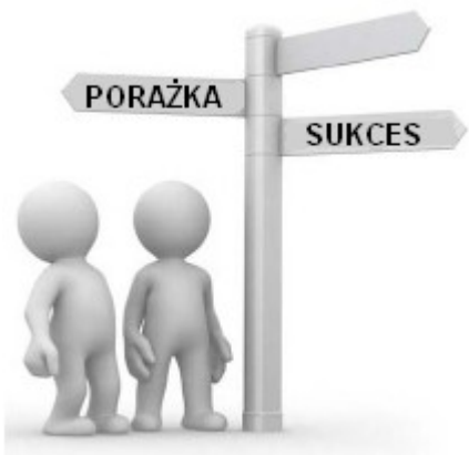
Rys. 1: Wybór należy do Ciebie.

A więc w tym kursie liczy się to, jak szybko wprowadzasz wiedzę w życie i wykonujesz ćwiczenia.